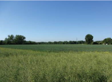
Le site est principalement occupé par de l'activité agricole.